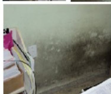
Figura 6: Posto de Saúde Vila Manaus

Considera-se que o posto de saúde da Vila Manaus, juntamente com o posto de saúde da Vila Belmiro apresentam as piores condições de conservação e manutenção, de acordo com a tabela 09. A umidade ascendente é a patologia construtiva que mais prejudica a saúde dos pacientes e trabalhadores, em face a presença de fungos e mofos. Analisando a figura 6 as paredes apresentam danos na pintura, trincas e fissuras.