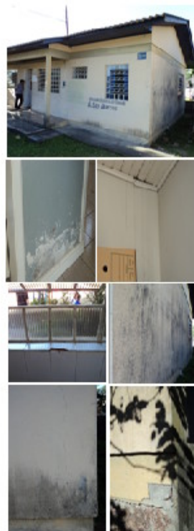
Figura 3: Posto de Saúde São Marcos

O posto de saúde do bairro São Marcos apresenta as patologias construtivas conforme descritos na tabela 06, verificou-se conforme a figura 3 que o prédio foi edificado numa parte baixa da região, contribuindo para presença de umidade ascendente nas paredes, em contrapartida aparecem problemas relacionados a pintura e, posteriormente de trincas e fissuras. O piso encontra-se desgastado e observou-se infiltrações de água da chuva pelo forro de madeira.