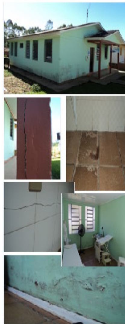
Figura 4: Posto de Saúde São Roque

O posto de saúde localizado no bairro São Roque é semelhante ao posto de saúde do bairro São Marcos. De acordo com a figura 4, as suas principais patologias construtivas são: a umidade ascendente, pintura, trincas e fissuras e adensamento do piso.