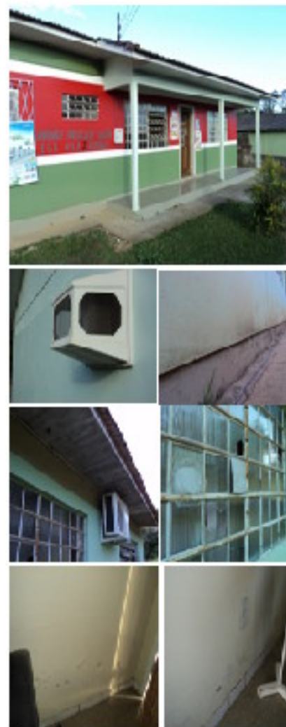
Figura 7: Posto de Saúde Vila Zuleima

O posto de saúde localizado na Vila Zuleima, conforme a figura 7, apresenta umidade ascendente, trincas e fissuras, problemas na pintura e infiltrações no forro, conforme tabela 10.