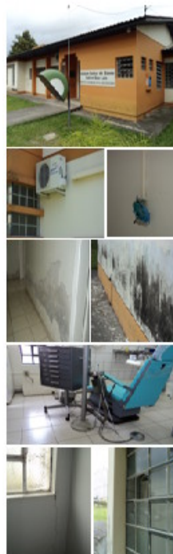
Figura 2: Posto de Saúde São Luiz

Na inspeção do posto de saúde do bairro São Luiz, verificou-se muitas patologias construtivas, descritas na tabela 05. As anomalias mais presentes, conforme figura 2, são: umidade ascendente, trincas e fissuras e, problemas na pintura. As instalações da tubulação de água e instalações elétricas, para funcionalidade da cadeira do dentista, não estão em conformidade com as normas técnicas.