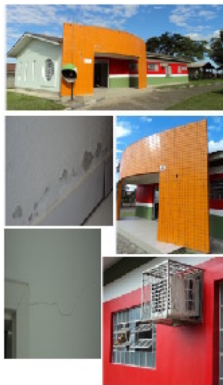
Figura 1: Posto de Saúde Mina União

Na inspeção do posto de saúde do bairro Mina União, conforme tabela 04, verificou-se que o mesmo encontra-se em melhor condição de conservação.